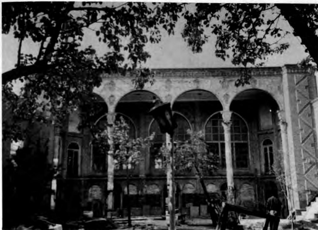
تبریز - خانه قدکی

قلعه خیرآباد (واقع در حومه شهر یزد) به ورزشگاه جوانان.