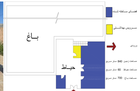
۳۳. نک: زرگر و حاتمی خانقاهی، همان.