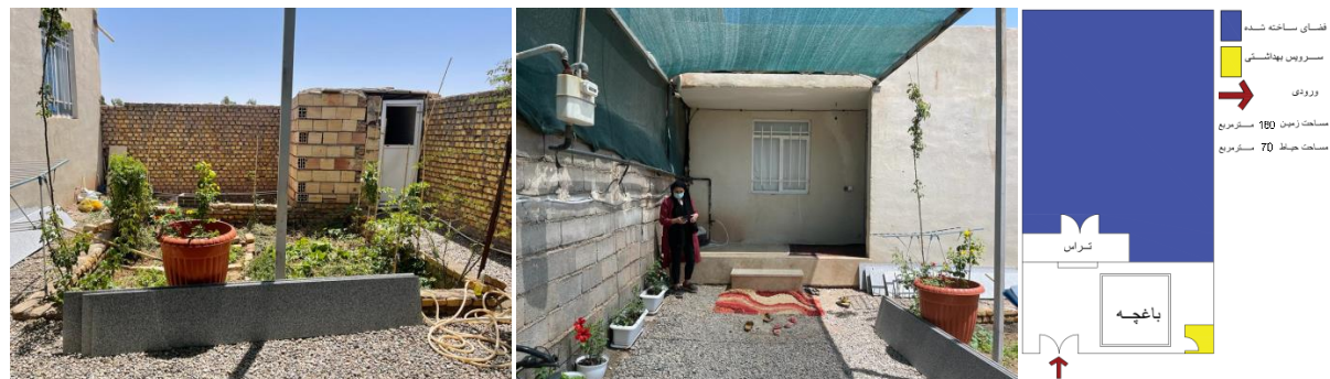
۳۵. نک: شیخ‌طاهری، طراحی خانه روستایی.

در پژوهش حاضر پس از دسته‌بندی ویژگی‌های حیاط و شناسایی وجوه اصلی آنها با عنوان متغیرهای مستقل و سه گروه خانه‌های روستایی سنتی، بازسازی‌شده، و معاصر با عنوان متغیر وابسته به تحلیل هریک در بخش یافته‌های پژوهش پرداخته می‌شود.