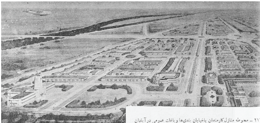
۲۱۷ – محوطه منازل کارمندان باخیا بان بندی‌ها و باغات عمومی در آبادان

– پرده دوم (مدرنیزاسیون با مدل بریتانیایی): مدرنیزاسیون گسترده در شهرهای نفتی و به‌طور ویژه در آبادان آغاز می‌شود. در این مرحله ساخت مسکن برای کارگران ایرانی شرکت شروع و به این ترتیب اولین مجموعه‌های مسکونی با الگویی اروپایی به کارگران ایرانی عرضه می‌شود. در الگوی جدید مسکن خانواده به‌ناچار باید مدرنیزه شود؛ چراکه امکان