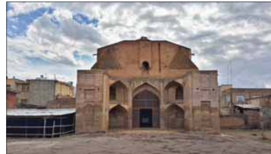
ت ۳ (راست، بالا). مسجد مدرسه حیدریه، مأخذ: http://tour-antalya.ir/?p=585 .