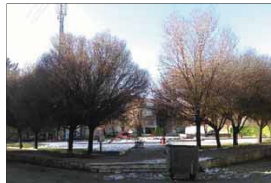
ت ۴ (چپ، بالا). آستانه امامزاده آمنه خاتون (س) مأخذ: http://amenehkhatoon-ghazvin.emamzadegan.ir/ ت ۵ (راست، پایین). فضای سبز محلی، عکس: محمد فائزی. ت ۶ (چپ، پایین). بقعه حمدالله مستوفی، مأخذ: www.info360vt.com/fa/aramgah-hmdallah-mstofi